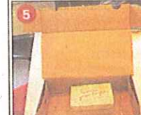
Beim Transport kann nun nichts mehr verrutschen.