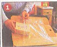
Das Produkt wird unter die Folie geschoben.