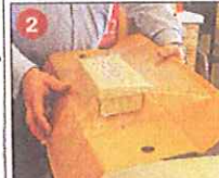
Nun die Längsseiten der Verpackung umklappen.