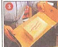
Die kurze Seite in die andere Richtung knicken.