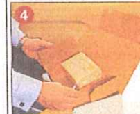
Anschließend in den Karton schieben.